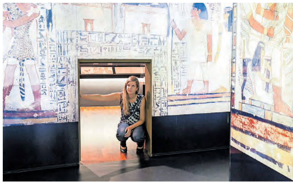
In den Reiss-Engelhorn-Museen gibt es am Museumstag einen spannenden Einblick ins Reich der Pharaonen

Reiss-Engelhorn-Museen, TECHNOSEUM, Kunsthalle und MARCHIVUM bieten spannendes Programm